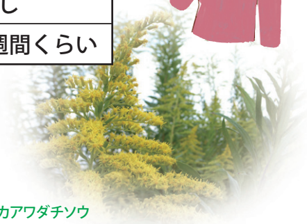
セイタカアワダチソウ